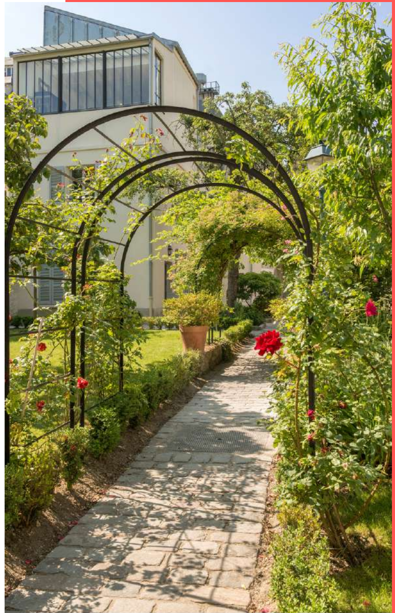
Musée de Montmartre - Jardins Renoir juin 2015

Un accompagnateur gratuit tous les 10 enfants. Les accompagnateurs supplémentaires doivent s'acquitter d'un droit d'entrée à 9,50 €.