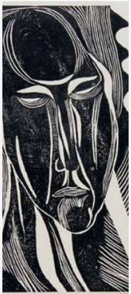
Otto Freundlich, 1878-1943

Cette recherche de l'harmonie et de la pureté prend sa source dans les mathématiques et la musique (néo-plasticisme). Les effets de la guerre et de sa monstruosité, ont amené certains artistes à utiliser l'abstraction pour représenter ce qui leur semblait impossible à montrer.