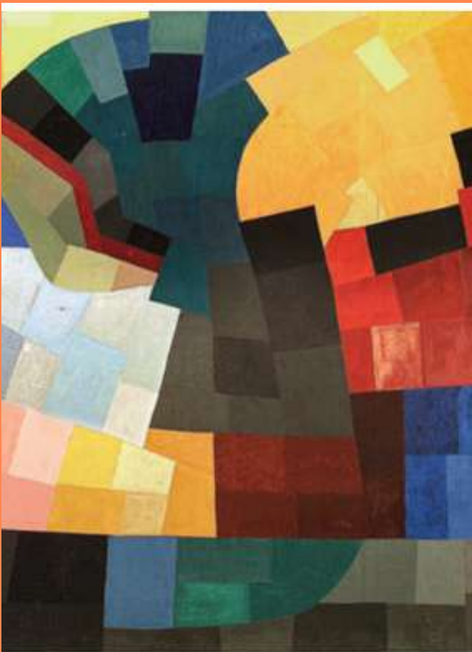
Otto Freundlich, 1878-1943 Composition , 1935

Alors, abstrait ou figuratif ? Petit exercice avec Otto Freundlich :