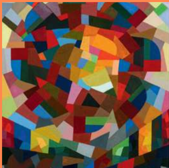
Otto Freundlich, 1878-1943 La Rosace II, 1941 Gouache sur carton, 65 × 50 cm Donation Freundlich – Musée de Pontoise

Nous veillons à adapter nos ateliers et discours sur les expositions aux différents publics scolaires.