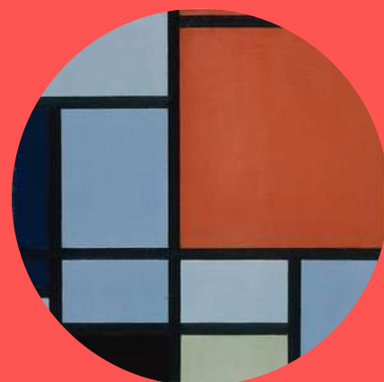
Piet Mondrian (1872-1944) Composition (détail) 1921, oeuvre présentée au MET