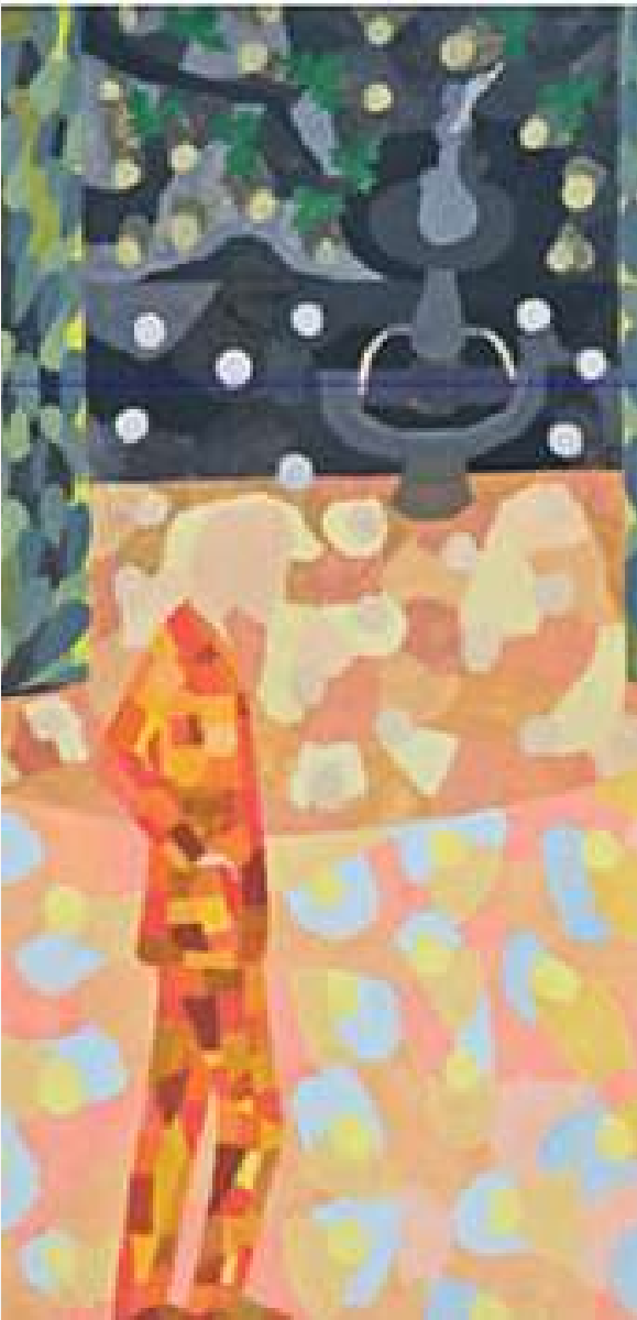
Otto Freundlich, 1878-1943 Homme devant une fontaine , 1911/1942 (détail) Gouache sur papier, 49 × 39 cm Donation Freundlich – Musée de Pontoise