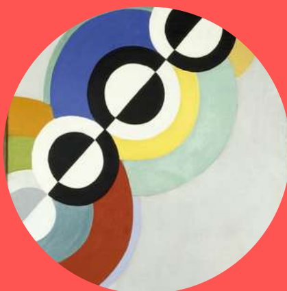
Robert Delaunay (12 avril 1885 - 25 oct. 1941) Rythmes (détail) 1934