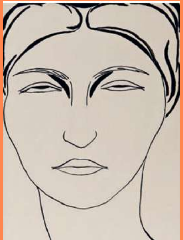
Otto Freundlich, 1878-1943 Portrait d'une femme , Vers 1915

Gouache sur papier marouflé sur contreplaqué, 108 × 99 cm Donation Freundlich – Musée de Pontoise