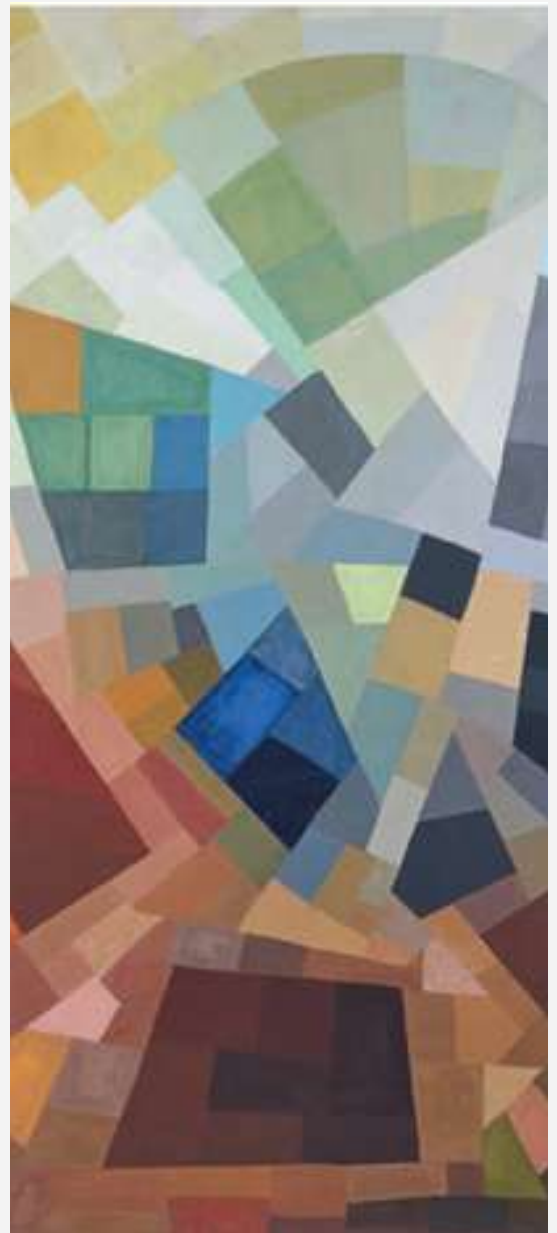
Otto Freundlich, 1878-1943 Composition (détail), 1939 Tempera sur papier marouflé sur toile, 193 × 146 cm Donation Freundlich – Musée de Pontoise

Le pacte germano-soviétique est signé le 23 août 1939 entre Hitler et Staline. Cela vaut pour une non-agression entre les pays mais aussi un accord d'invasion et de partage de la Pologne. Le 1er septembre 1939, Hitler envahit la Pologne, alliée à la France. Le 3 septembre, la France et le Royaume-Uni déclarent la guerre à l'Allemagne. A la fin du mois, la Pologne est totalement conquise. Le 14 Juin 1940, Paris est prise et 2 jours plus tard et nommé à la présidence du conseil le Maréchal Pétain.