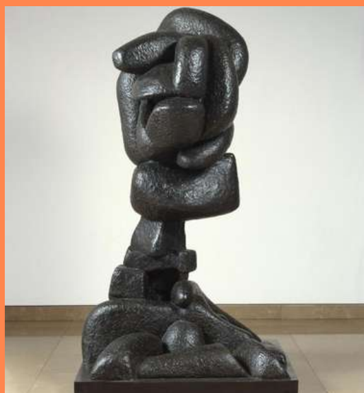
Otto Freundlich, 1878-1943 Ascension (détail) , 1929 Bronze, 200 × 104 × 104 cm Donation Freundlich – Musée de Pontoise

Les enfants imaginent et créent une sculpture abstraite en argile.