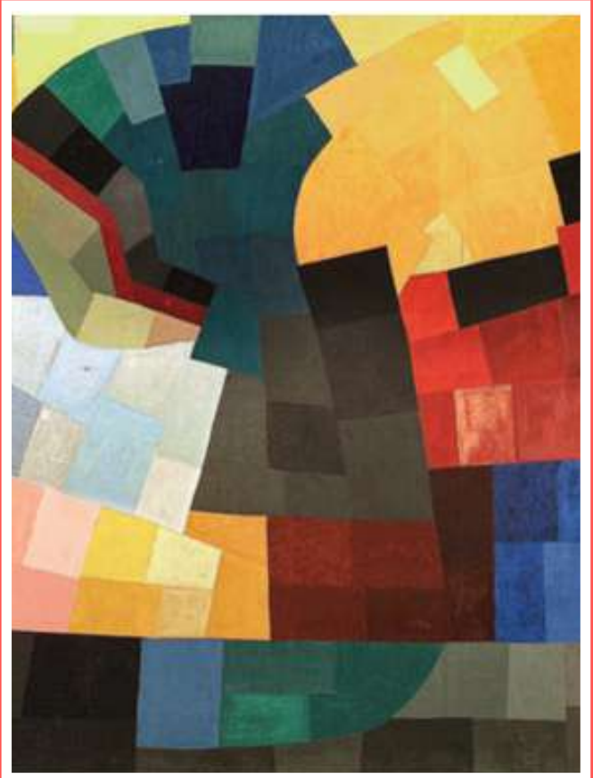
Otto Freundlich, 1878-1943 Composition , 1935 (détail) Gouache sur papier marouflé sur contreplaqué, 108 × 99 cm Donation Freundlich – Musée de Pontoise

Enfin, l'exposition, conçue comme une véritable plongée dans la création de l'artiste et mettant en lumière des œuvres parfois surprenantes, peut donner lieu à un travail d'expression ou à un débat sur la question de la représentation visuelle, du beau, de l'art figuratif et de l'abstraction .