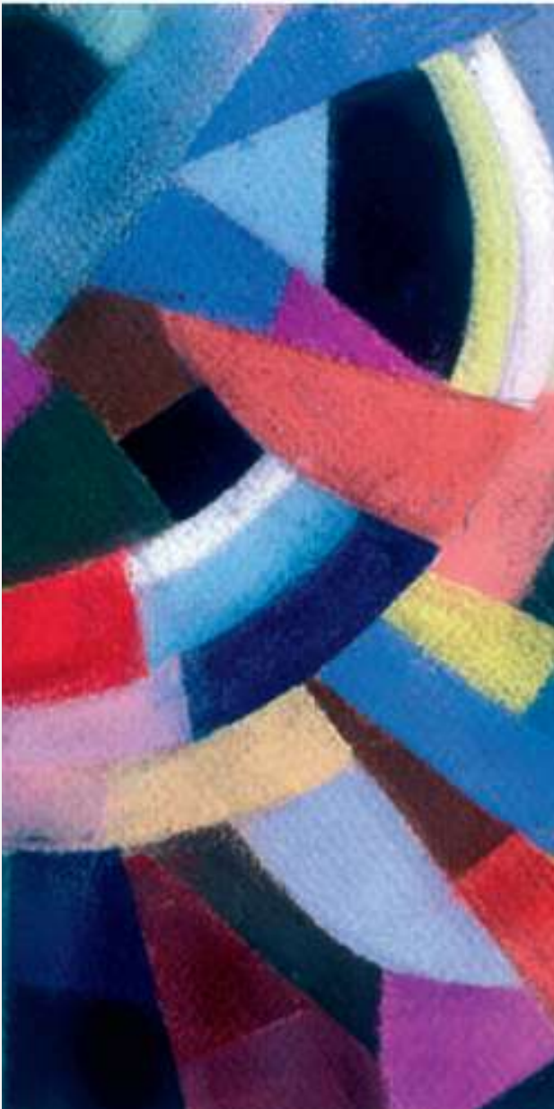
Otto Freundlich, 1878-1943 Composition , 1930-1940 Pastel sur papier, 31,5 × 24 cm