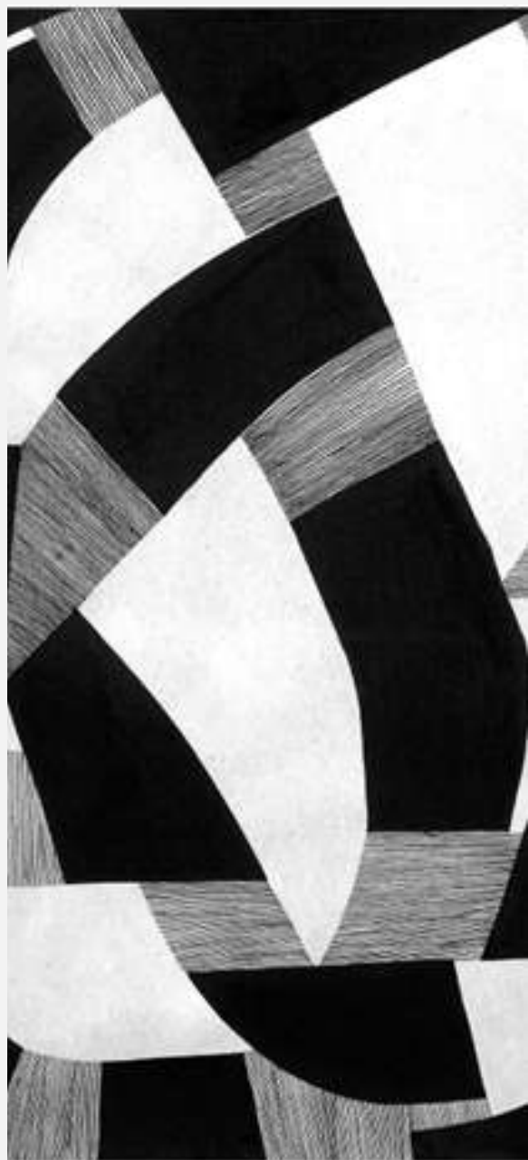
Otto Freundlich, 1878-1943 Composition (détail), 1936 Encre sur papier, 63 × 48 cm Donation Freundlich – Musée de Pontoise

Otto Freundlich débarque à Paris pour la première fois en mars 1908 et s'installe dans un atelier au Bateau-Lavoir où il fait la connaissance de Pablo Picasso. Il côtoiera également les différents cercles artistiques et littéraires de Montmartre, et se liera d'amitié avec des grands noms tel que Guillaume Apollinaire ou encore Georges Braque.